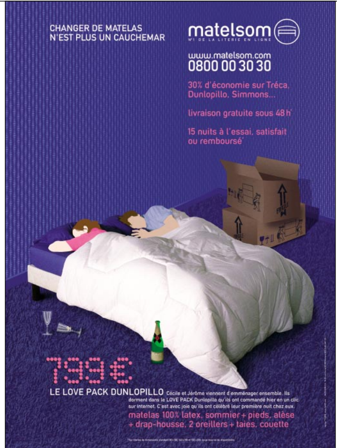
Für Pärchen, die mit ihrer alten Wohnung auch die alten Matratzen ad acta legen, ist das Love Pack gedacht