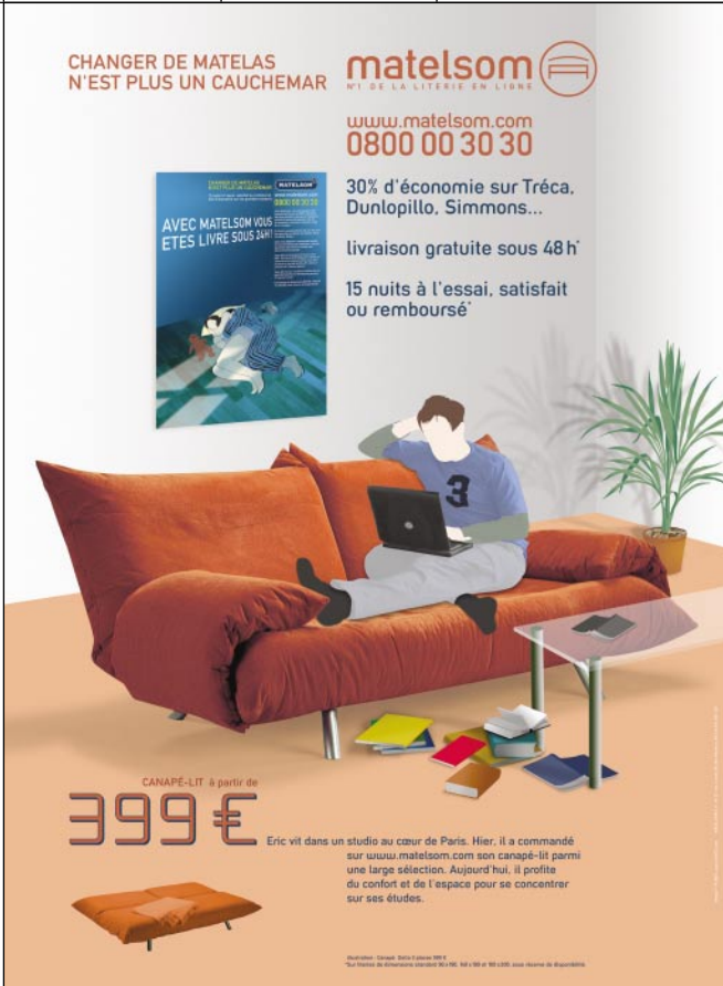
Jedes der Poster spricht eine andere Zielgruppe an - hier den Studenten, dessen Sofa auch als Bett fungieren muss