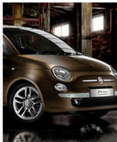
DIESEL UNIVERSITY March 23, 2009

イタリアのプレミアム・カジュアル・ブランドDIESELがディーゼルのモバイルサイトと全国のディーゼルスストアにて、2009年3月11日(水)~4月7日(火)の期間限定のDIESEL UNIVERSITYを開校している。ディーゼルのモバイルサイトではDIESEL UNIVERSITYのモバイルコース“DIESEL CHALLENGE”を開講。ディーゼルのまっわるPOP QUIZを実施する。