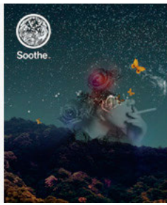
Soothe one-man live 2009 March 25, 2009

津軽三味線・和太鼓・ギター・ベース・ドラムからなるインストゥルメンタル ジャムバンド[Soothe]が、2009年4月25日(土)に、duo MUSIC EXCHANGEにてワンマンライブを開催する。今回のワンマンライブでは、ミュージシャンはもちろん、世界的に有名なアーティストとの映像によるコラボも予定している。初夏には3枚のアルバムも、リリースされる予定で、今回は、特別にLive会場のみでの先行発売もおこなわれる。今後注目のバンドだけにぜひ足を運んで欲しい。