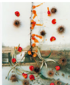
Hackney Flowers March 7, 2009

G/P galleryにて2月27日(金)から、今世界で最も注目される写真家の一人、スティーヴン・ギルの日本初個展となる『Hackney Flowers』を開催中。作家の代表作である同名のシリーズは全47点で構成されており、今回はオリジナルプリントを10点展示、また本展会中には同シリーズ全47点を含めたオリジナルプリントを販売している。